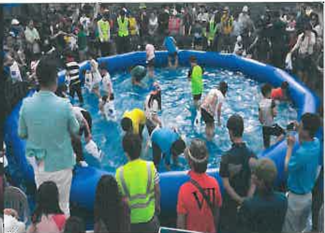
체험행사 : 맨손붕어잡기