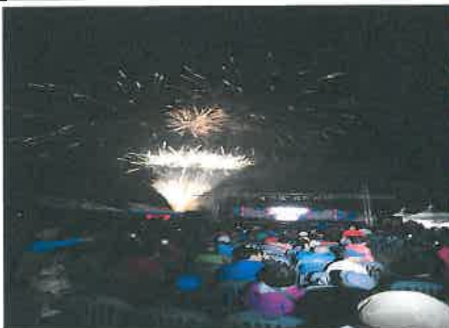
개막행사 : 불꽃놀이