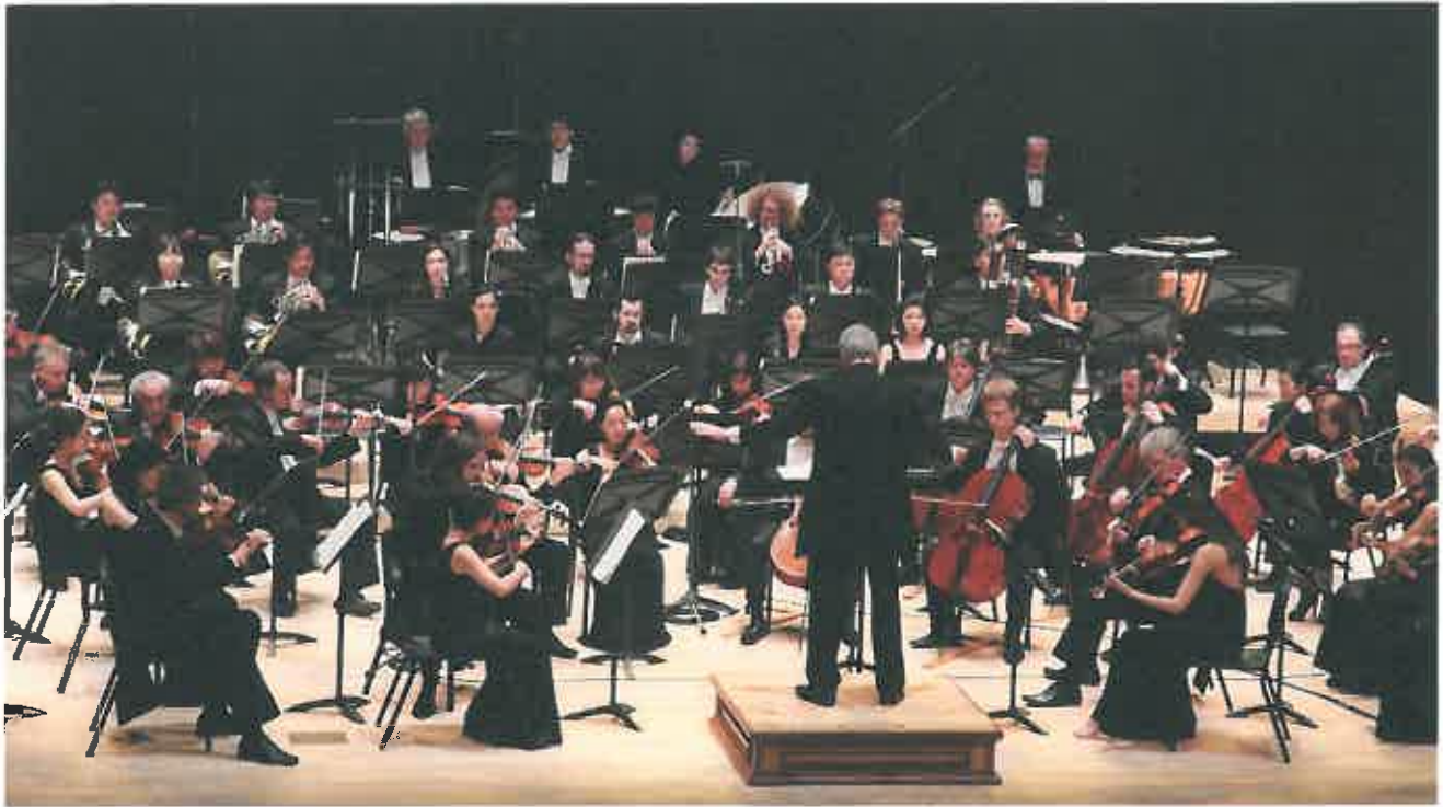
▲ 통영국제음악제 공연모습