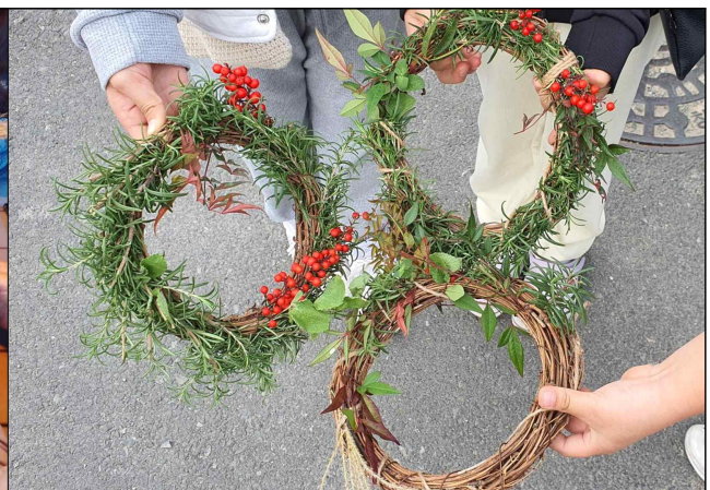
자연물 리스 만들기