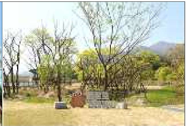
동정호 생태습지 탐방