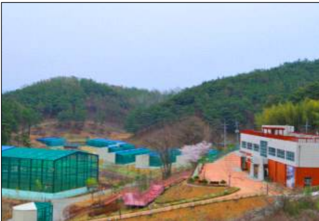
따오기 복원센터 관람