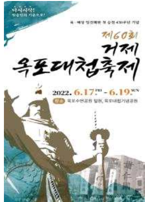
제60회 옥포대첩 축제 (6.17.~6.19)